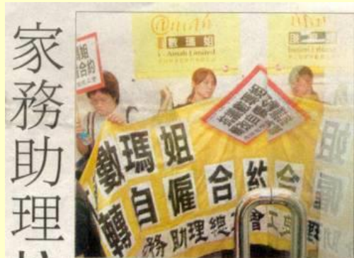
十名家務助理昨日早上帶同抗議橫額，到僱傭公司抗議合約被改為自僱人士。

【明報專訊】十名被騙簽下自僱合約的家務助理，昨日在工會陪同下，到受僱的鐘點女傭介紹所抗議，要求取消有關令她們得不到任何勞工保障的自僱合約。